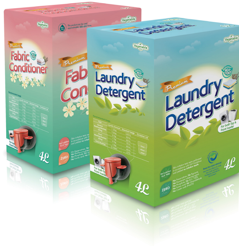
홈케어 해외수출용 세탁세제 및 섬유유연제 백인박스(BIB) 패키지