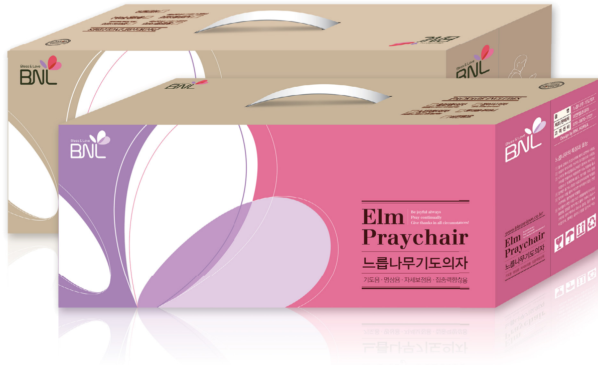
비앤엘코리아 느름나무기도의자 패키지