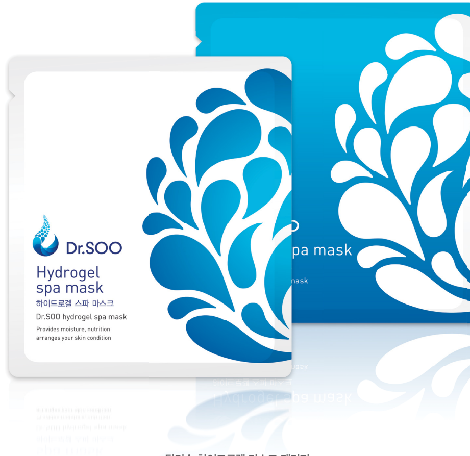
닥터수 하이드로겔 마스크 패키지