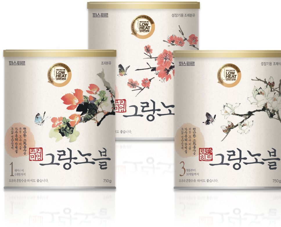
파스퇴르 프리미엄 그랑노블 패키지리뉴얼