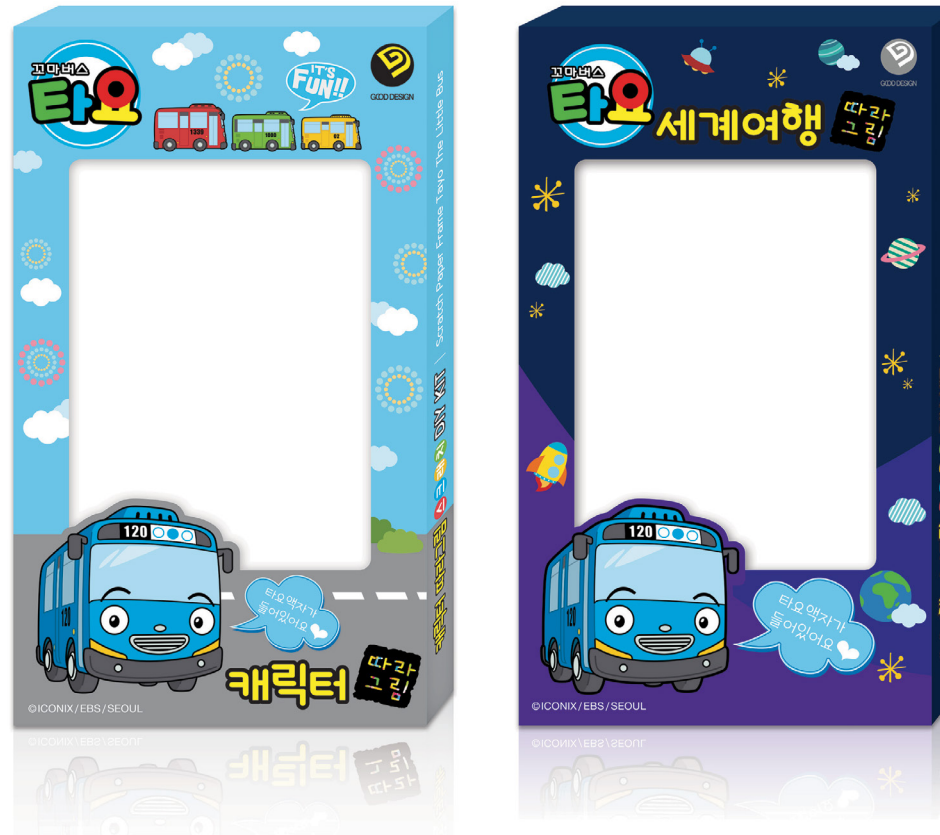
글찬마루 꼬마버스 타요 세계여행 따라그림 패키지