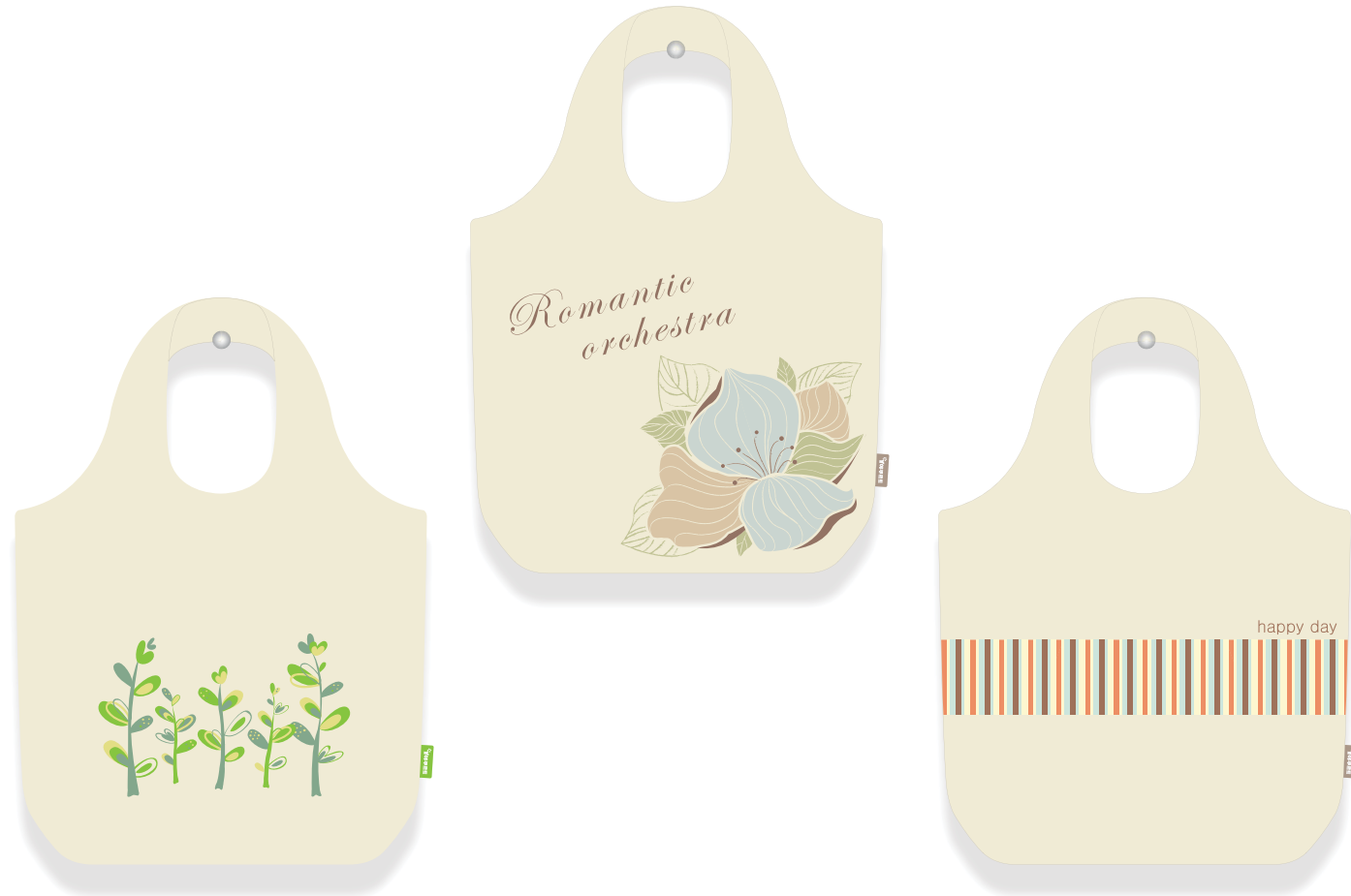
한국아쿠르트 에코백 디자인