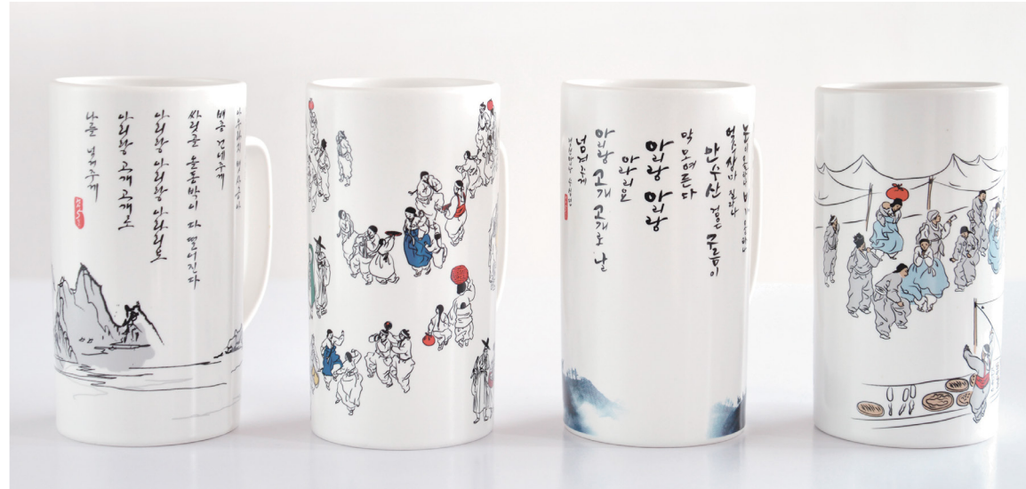
정선군 VIP 기념품 머그컵 패키지